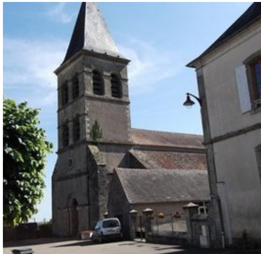
L'église de Saint-Révérien (Nièvre)